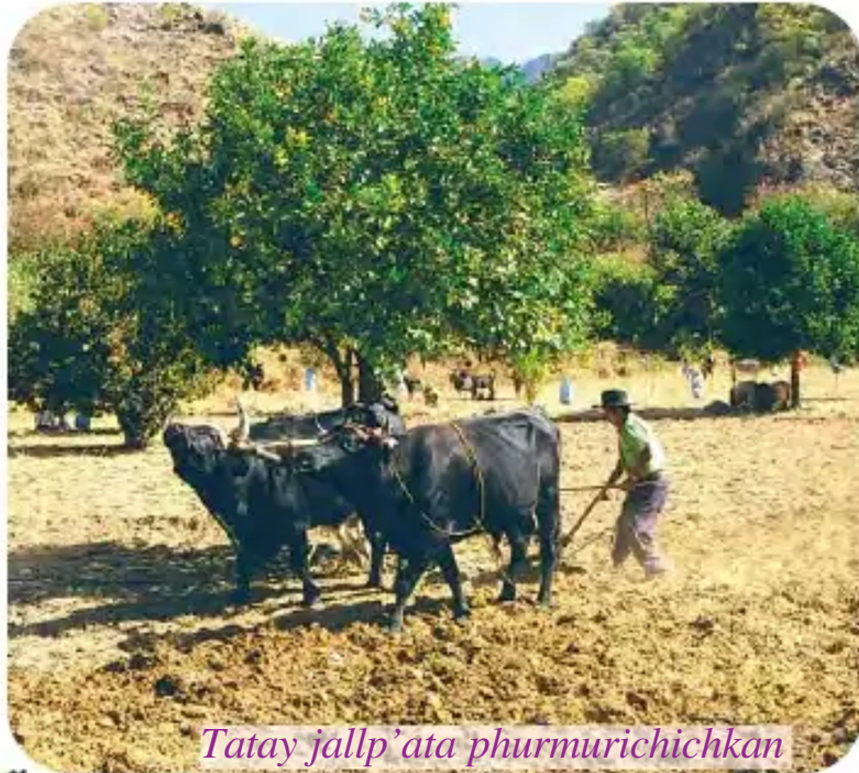
Tatay jallp'ata phurmurichichkan