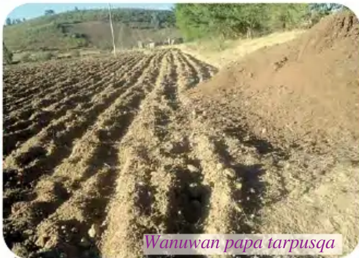
Wanuwán papa tarpusqa