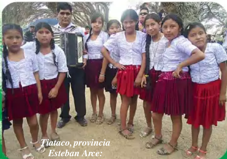
Tiataco, provincia Esteban Arce: