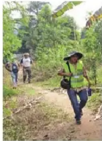
Página Siete LaPaz

“Desde que las autoridades gubernamentales ingresaron a las comunidades, que habitan en el territorio indígena, con obsequios y promesas, la armonía de las comunidades se disipa”.