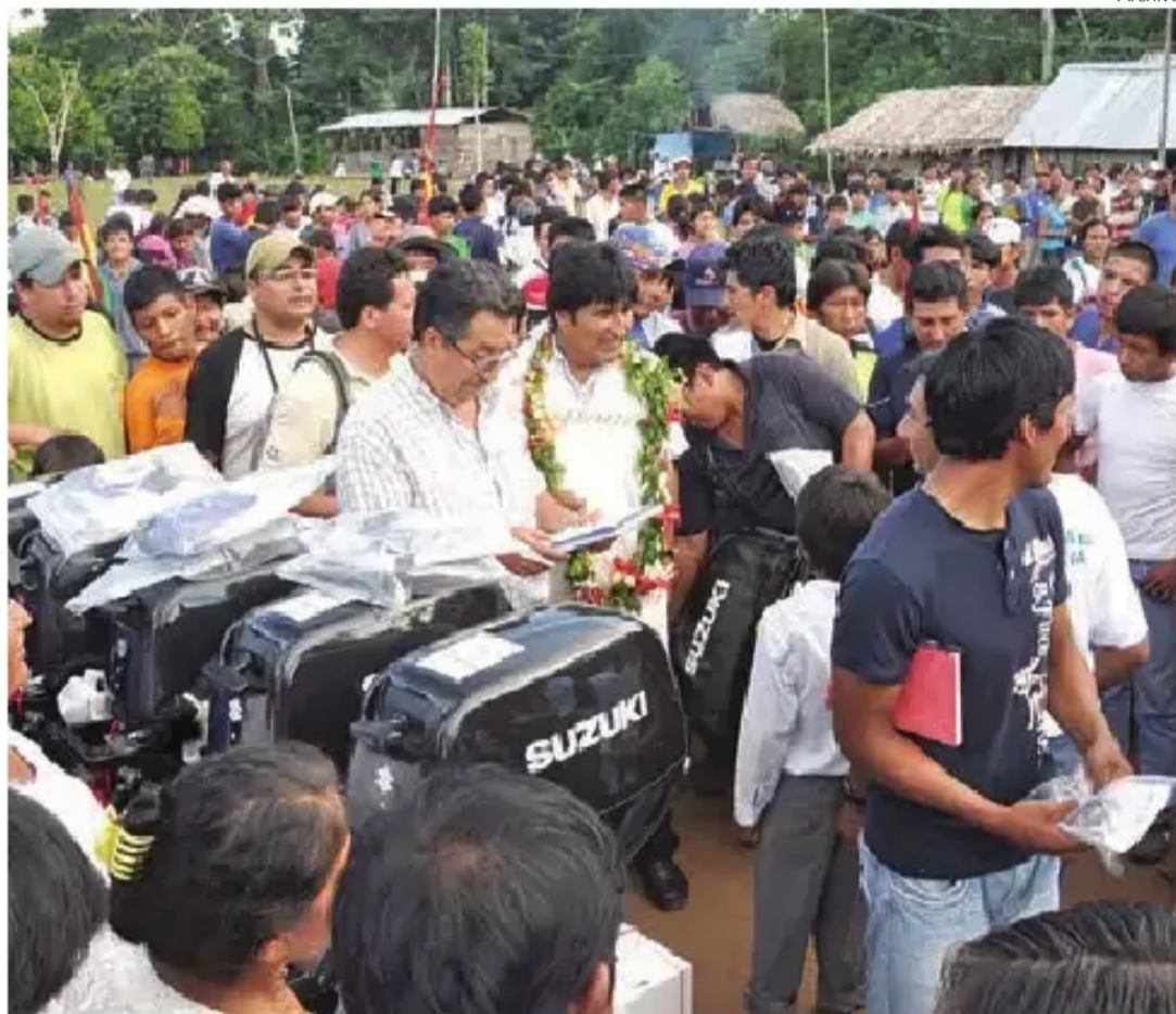
El presidente Evo Morales en una concentración a favor de la carretera por el TIPNIS.

El avance de los marchistas dejó en exposición, de a poco, el empecinamiento de la cúpula gubernamental por construir la carretera interdepartamental.