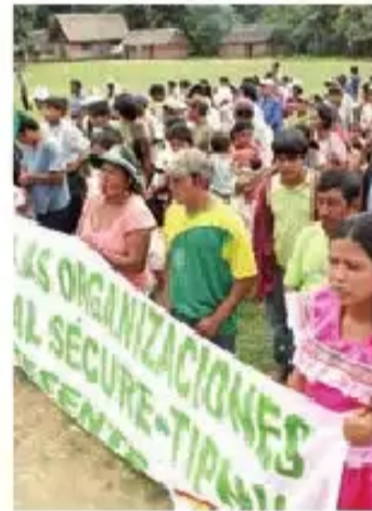
Indígenas durante un acto realizado en el parque.

“Sólo se reparten entre quienes apoyan la consulta. Otros comunarios han visto sacar el combustible tarde, en la noche”, se comentó en la reunión. La notoria división indígena fue advertida por los comunarios, quienes identifican al Gobierno como el principal culpable de ese hecho. “Repudiamos el comportamiento del Gobierno, que viene dividiéndonos como comunidades y estructuras, hechos que no permitiremos en adelante, así sea ofrendando nuestras vidas”, señala parte de un documento firmado por representantes de 22 comunidades que se reunieron hace dos semanas en San Pa-