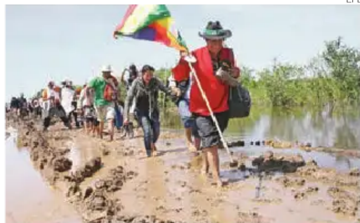
Los indígenas atravesando las barreras de la naturaleza.

Semanas antes del inicio de la consulta, el presidente Evo Morales realizó una gira por las regiones del TIPNIS llevando una serie de obsequios y el Ministerio de Comunicación organizó visitas de periodistas, empresarios y otros sectores de la población al territorio indígena para socializar su proyecto de la vía que atraviesa por una de las reservas naturales más importantes de Bolivia.