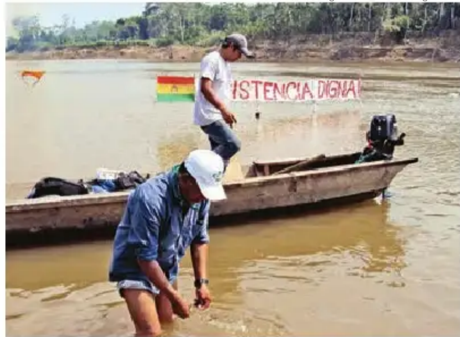
Indígenas del TIPNIS resisten el ingreso de brigadas en el río Isiboro.

En una reunión comunal en Gundonovia, la gente que hace la resistencia a la consulta reconoció que a principios de año el Gobierno cumplió con la comunidad instalando dos depósitos de combustible, pero a la vez criticó que los encargados de la llave de paso vivan en Trinidad y no les reparten el combustible.