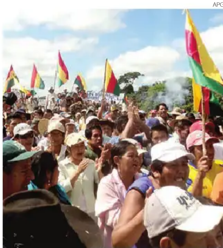
La marcha, a la salida de Trinidad, Beni.

▶ Tres indígenas murieron por el frío: un bebé y dos adultos.