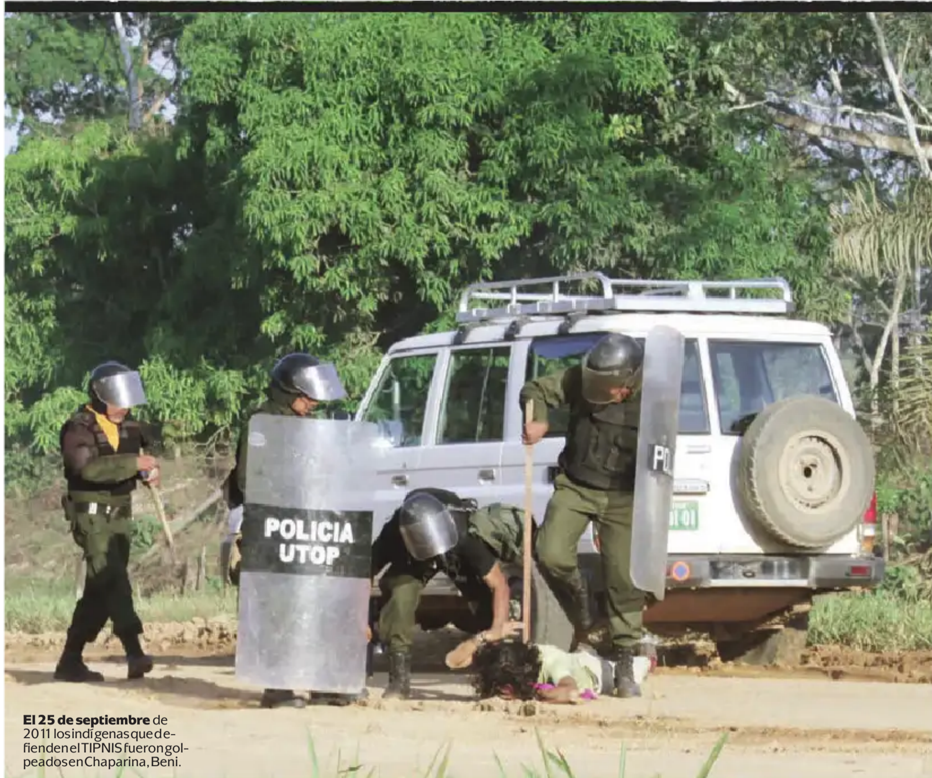
El 25 de septiembre de 2011 los indígenas que defienden el TIPNIS fueron golpeados en Chaparina, Beni.