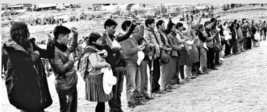
"Dirigentes juran para cumplir el mandato de las bases"

¿Cómo lograr que el pueblo recupere su soberanía popular en la toma de decisiones?