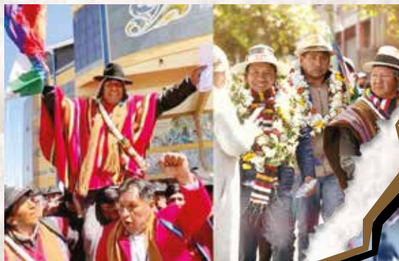
Dos cabezas en la CSUTCB

Las organizaciones matrices como la CSUTCB, CNMCIQB-BS, CIDOB, APG, CONAMAQ, ADEPCOCA tienen dos cabezas. El Pacto de UNIDAD también está dividido (Arcistas-Evistas). En el XVIII Congreso de la CSUTCB estalló la división, una feroz pelea durante dos días, 800 heridos, gasificación, apagón de luces, silbidos, abucheos, insultos, gritos (18, 19 agosto, 2023).