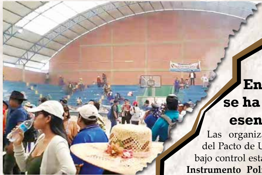
XVI Congreso de Mujeres gasificado en Parotani

“El movimiento campesino ha pasado por muchas luchas, hemos sido derrotados y también hemos derrotado, eso ¿de qué ha servido? Algunos errores nos pueden separar: como el tema TIPNIS, o la ley Minera, que es contraria a los campesinos, prioriza la actividad minera y después recién la comunidad, el caso de la tierra, 5 mil hectáreas o 10 mil hectáreas? El pueblo ha votado por 5 mil hectáreas. Ya no hay reversión al Estado de la superficie excedente para su redistribución, eso han decidido fuera de la Constitución ‘que tenga nomás lo que tenían sembrado 15 mil y 10 mil’. Esos hechos pueden dividirnos. Dije, estamos prohibidos de equivocarnos. Si gobernando el país los campesinos nos equivocamos ¡Estamos jodidos!” Juan de la Cruz Villca (+), Exsecretario Gral. Central Obrera Boliviana (COB) y Ejecutivo de la Confederación Sindical Única de Trabajadores Campesinos de Bolivia (CSUTCB)